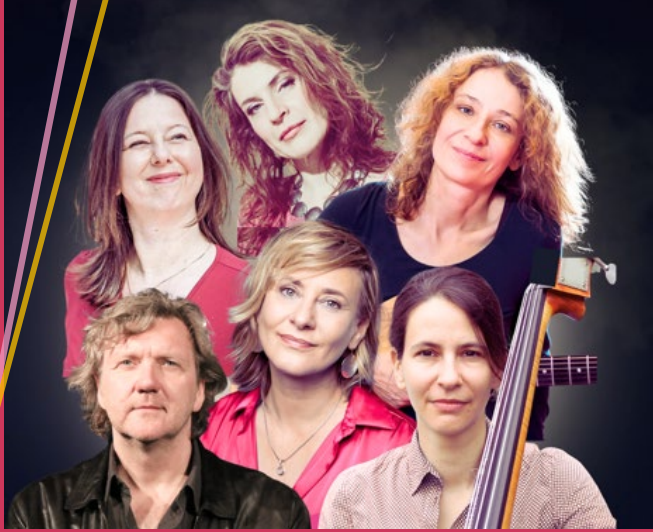
Collage © Britta Rex